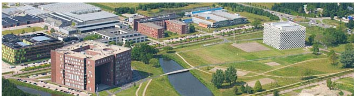
Universidade de Wageningen – Holanda